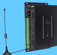
司水云官智能终端